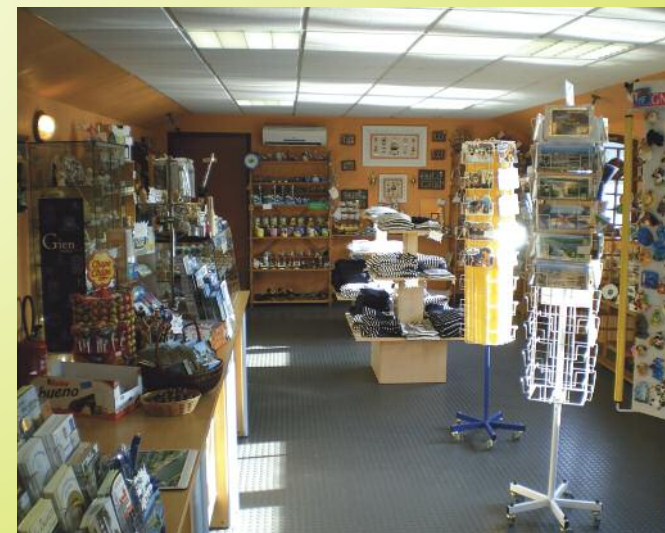
La Péniche Souvenirs Cadeaux et Produits régionaux

Le Canal de Briare est l'un des plus anciens canaux de France. Il traverse des paysages verdoyants et vallonnés. A bord de nos confortables bateaux, le passage d'écluses pittoresques et la navigation sur ces chemins d'eau vous feront découvrir le charme sans égal des canaux de Briare.