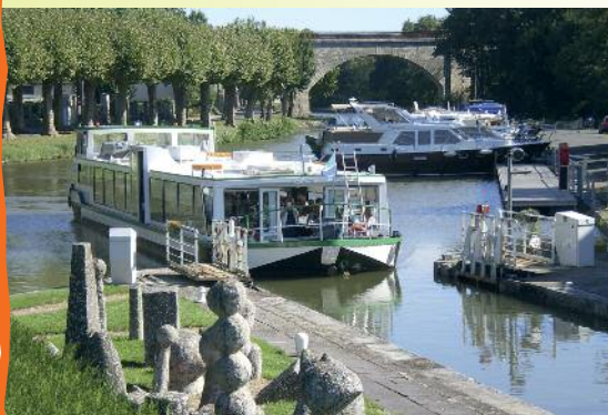
La composition de nos menus est à votre disposition dans la salle

KIR Coquille Feuilleté fruits de mer et St-Jacques Cuisse de Pintade sauce Forestière Poêlée à la Sarladaise Méli-mélo Campagnard Brie et Salade Café gourmand 1/4 de Vin Rouge