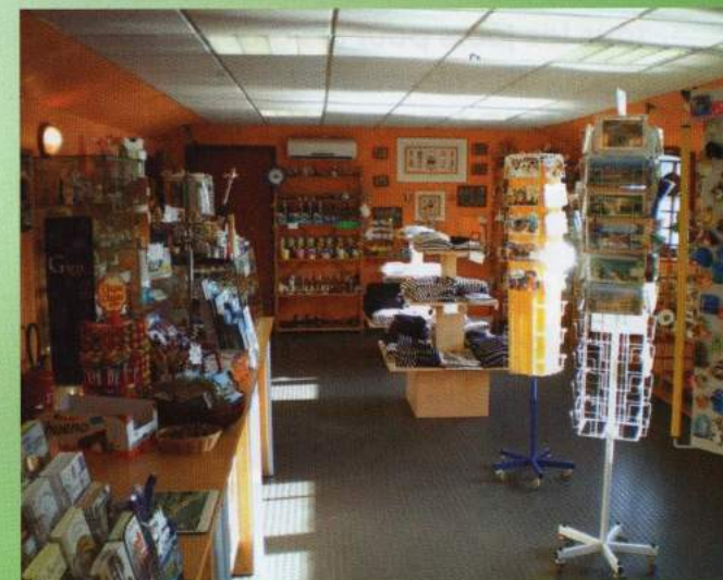
La Péniche Souvenirs Cadeaux et Produits régionaux

Le Canal de Briare est l'un des plus anciens canaux de France. Il traverse des paysages verdoyants et vallonnés. A bord de nos confortables bateaux, le passage d'écluses pittoresques et la navigation sur ces chemins d'eau vous feront découvrir le charme sans égal des canaux de Briare.