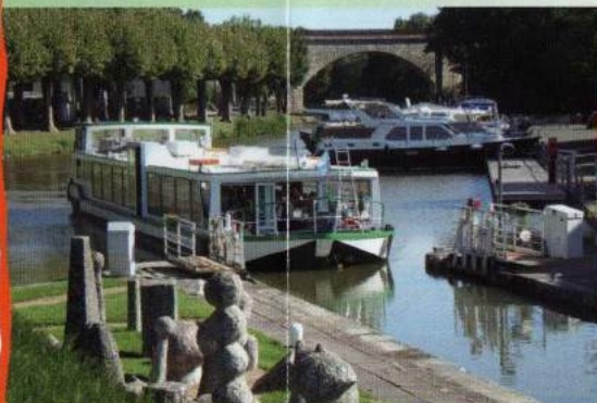
La composition de nos menus est à votre disposition dans la salle

KIR Foie Gras et son accompagnement Rôti de Chapon sauce Sancerre Mini Gratin de Pomme de Terre aux Girolles Fagot de Haricots Verts Brie et Salade Café gourmand 1/4 de Vin Rouge